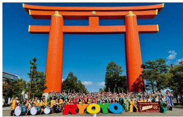
京都両洋高等学校 吹奏学部による演奏