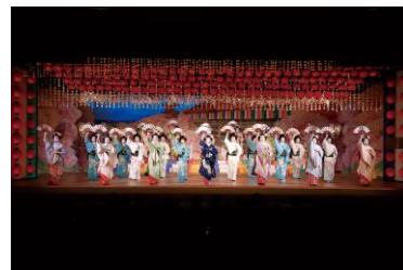
宮川町芸舞妓による舞踊