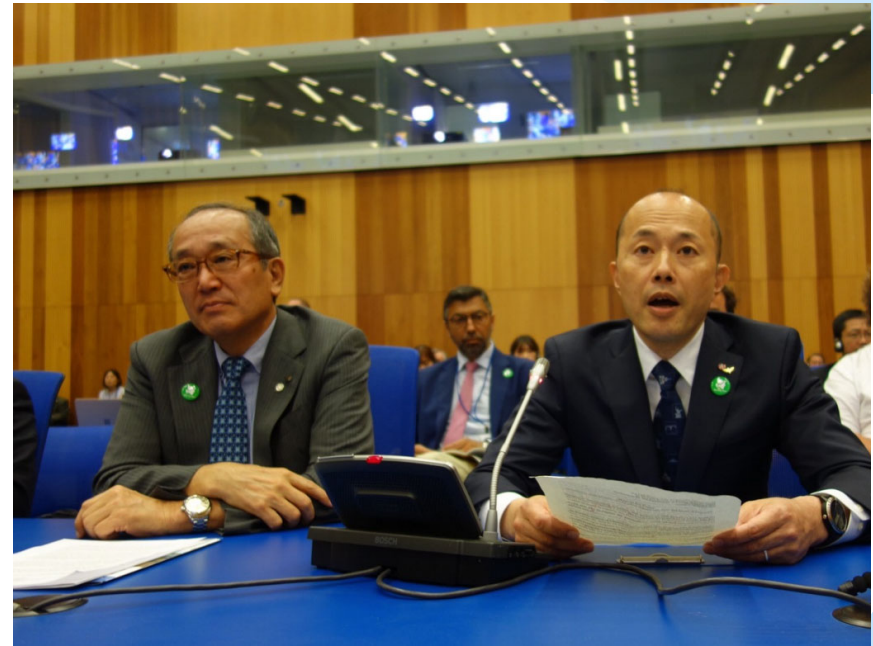
NPT再検討会議第1回準備委員会 First Session of the Preparatory Committee for the 11th NPT Review Conference