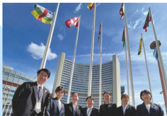
ナガサキ・ユース 代表団 Nagasaki Youth Delegation