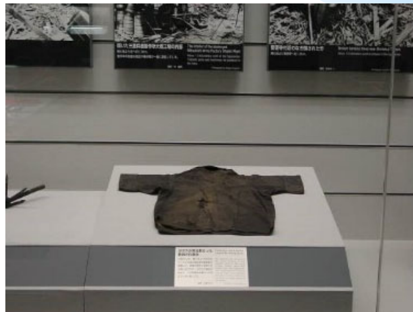
多数のガラス片を受けた作業着 Work jacket pierced by glass fragments