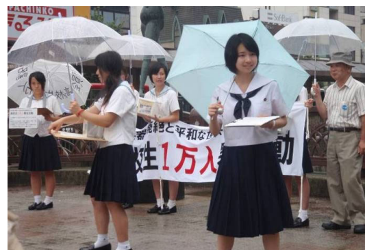
高校生一万人署名 10,000 High School Students Signature Campaign