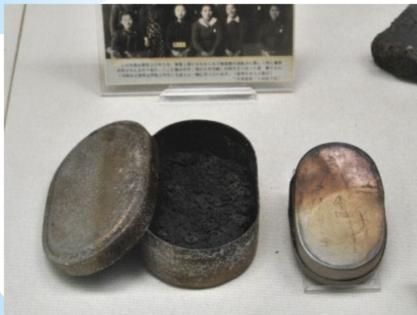
女子学生の弁当箱 School girl's lunch box