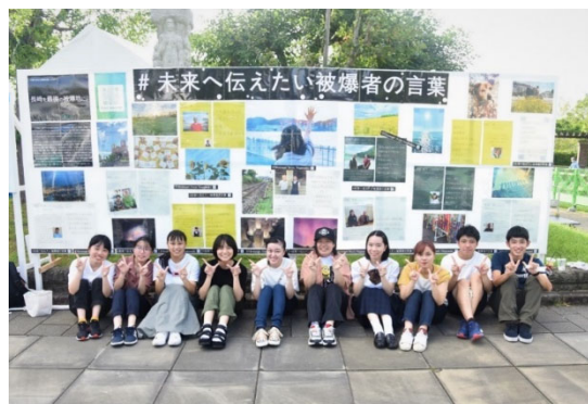
青少年 ピースボランティア Youth Peace Volunteers