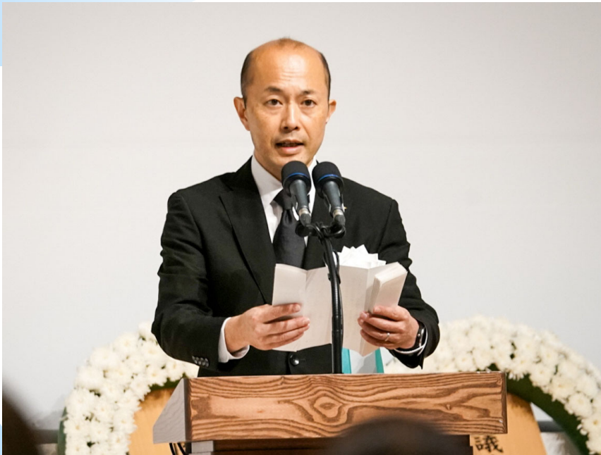
第78回平和祈念式典 The 78 th Nagasaki Peace Ceremony