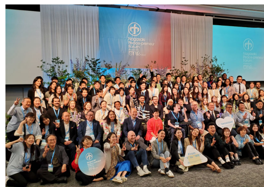
ワン・ヤング・ワールド 分科会 Nagasaki Peace- preneur Forum powered by One Young World