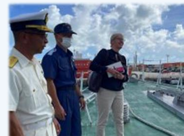
招聘記者による 現場取材の様子

国際社会が、気候変動や先進国の少子高齢化をはじめとする世界共通の課題に直面するようになる中、それらの課題に最前線で立ち向かう日本の取組みは世界の注目を集めています。また、訪日観光客数の増加が示すように、旅行先としての日本への関心も高まっています。FPCJは今後も日本の魅力や強みが外国メディアを通じて世界に発信されるよう、取り組みます。