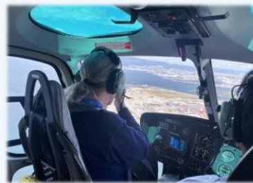
工事が進む大阪・関西万博 の会場をヘリから取材

FPCJでは、外国メディアのニーズと日本からの対外情報発信の必要性を常に考えながら、在日外国メディア記者や海外から日本を訪れる記者を対象に、様々な取材協力や情報提供を実施。具体的には、人口減少や高齢化の問題、日本を取り巻く安全保障環境、東京電力福島第一原発のALPS処理水の取扱いなどの重要なテーマについて、プレス・ブリーフィングやプレスツアー、外国メディア招聘などの各事業で多角的に取り上げました。