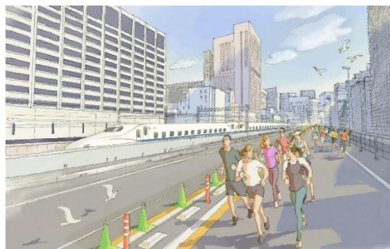
モーニングプログラムイメージ