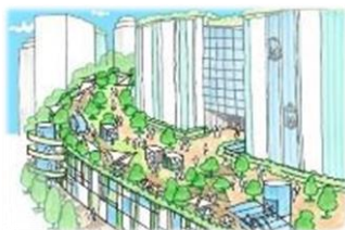
地区間をつなぐ歩行者ネットワークが創出されます