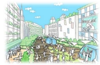
にぎわいと交流の場としての公共的空間が創出されます