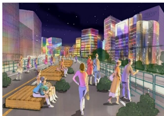
ナイトプログラムイメージ