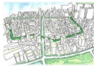
東京に新しいみどりのネットワークが形成されます