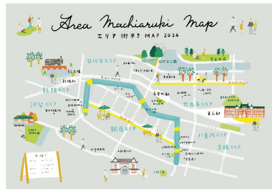
まち歩きマップ（制作中）

KK 線の周辺地域と連携した広域のイラストマップを配布します。KK 線がたなぐ複数のエリアを回遊するガイドとして、当日是非ご利用ください。