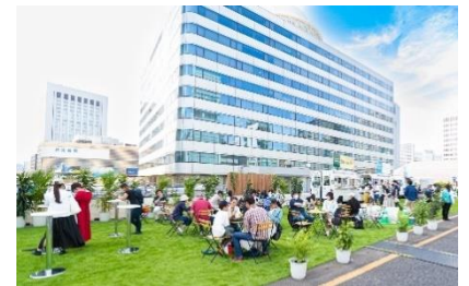
昨年（2023）実施したイベントの様子