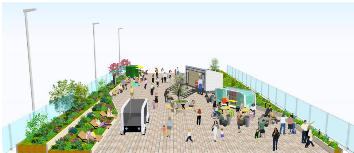
整備内容の例（幅員が約 16m 以上の区間）