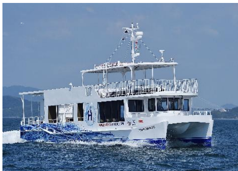
水素エネルギーの利用（イメージ）