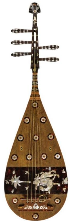
螺鈿紫檀五絃琵琶