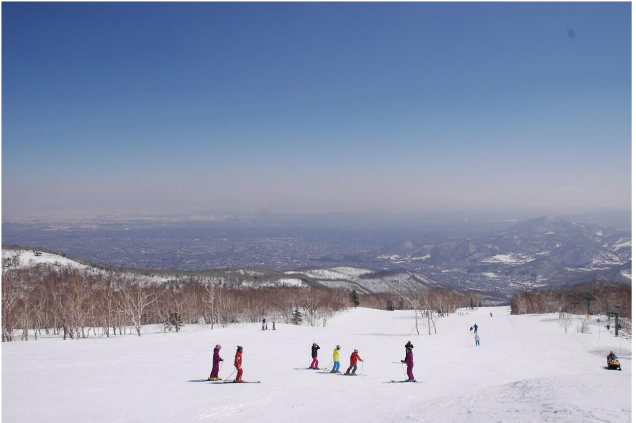
照片：札幌手稻滑雪场

虽然等待这些内容的再次到来，需要静候下个冬天，但是 3 月份就开始觉得遗憾其实也太快了。之所以这么说，是因为札幌到 5 月上旬为止都可以滑雪。而我这次要特别介绍及推荐的就是，从札幌市中心驱车 40 分钟，从手稻火车站乘车 16 分钟就可以到达的“札幌手稻滑雪场”。