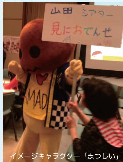
イメージキャラクター「まつしい」