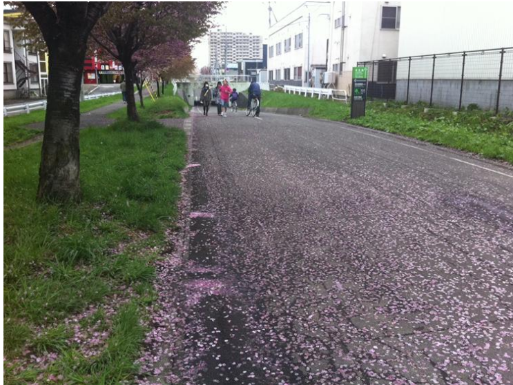
春天的白石自行车专用道就是一张粉红的地毯

另外这条自行车专用道的另一大魅力就是：可亲身感受四季的推移变幻。每到春天，樱花盛开，穿过樱花树的隧道顺坡而下，又能欣赏粉红山樱和五彩缤纷的郁金香。樱花季节之后，路旁又有丁香花的芬芳迎接大家。一到夏天，参天大树围成的绿色隧道让人心旷神怡；秋天一到，白桦和银杏的叶子渐渐染成金黄色，又是观赏红叶的好去处！