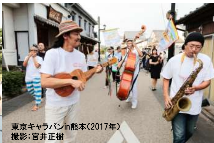
東京キャラバンin熊本(2017年)