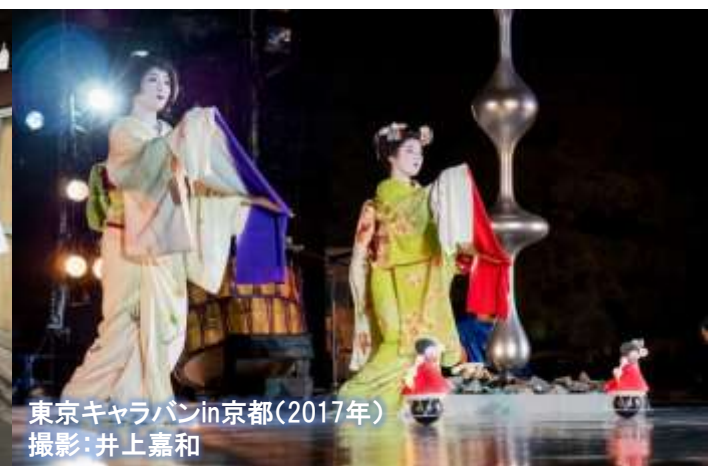
東京キャラバンin京都(2017年)